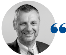
Patrick GENSAC Président du tribunal administratif de Limoges

L'année 2021 signe le maintien d'une activité soutenue au sein du tribunal administratif de Limoges. Contrairement à l'année précédente, le tribunal a constaté une hausse des recours de 4,5 % (soit 2 046, contre 1 958 en 2020). Traitant majoritairement du contentieux des étrangers (38,27 %), le tribunal a jugé 1 992 affaires dans un contexte d'accroissement des recours en référé. Par ailleurs, le délai prévisible de jugement a été ramené à 10 mois et 20 jours, soit 72 jours de moins qu'en 2020.